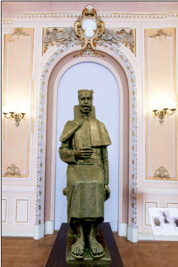
George D. Anghel - Theodor Pallady

Revistă de cultură fondată la Craiova, în 1927, serie nouă, din ianuarie 2003 Publicată de Scrisul Românesc Fundația-Editura, recunoscută CNCS